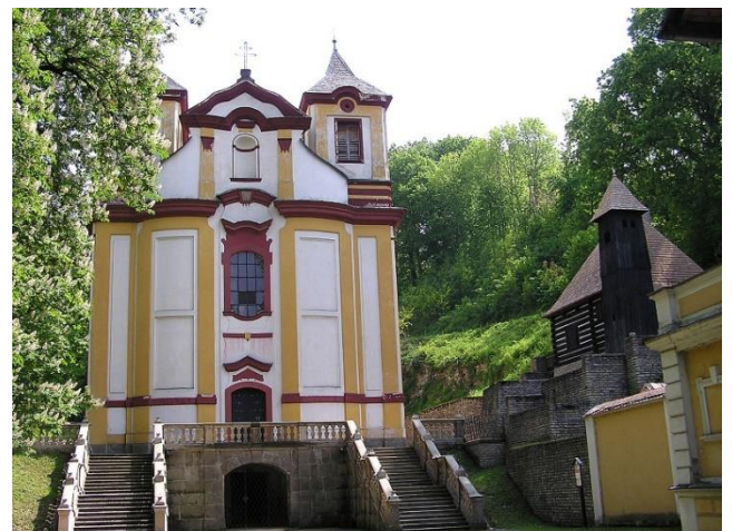
Barokní kostel sv. Mikuláše a dřevěná poustevna na Vraclavi

Během letních měsíců je otevřen Barokního areálu Vraclav. Můžete zde navštívit kostel sv. Mikuláše, ve kterém se nachází soubor plastik z 1. poloviny 18. století. Sochy byly původně umístěny podél cesty z Králík ke klášteru v Hedči. Dále je zde k vidění budova bývalých lázní s expozicí