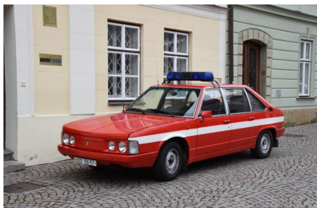
Muzejní Tatra 613

Regionální muzeum ve Vysokém Mýtě nabízí komentované projížďky Tatrau 613 po Vysokém Mýtě a okolí. Zájemci se mohou svézt historickým vozem Tatra 613 v doprovodu pracovníka muzea, který jim podá výklad nejen k historickým místům ve městě a jeho okolí, ale také k samotnému vozu. Tento konkrétní automobil zakoupil národní podnik Karosa roku 1988 jak vůz pro svého ředitele. Původně měl vínovou barvu, ale po předání podnikovým hasičům byl červeno-bíle přestříkán, opatřen modrými majáky a náležitým vybavením pro likvidaci drobných požárů. Muzeu ve Vysokém Mýtě byl darován v březnu 2020. Komentovaná projížďka pro 1 až 3 osoby trvá přibližně 40 minut. Cena za projížďku činí 1200,- Kč bez ohledu na počet cestujících. V případě zájmu se obraťte na muzejní email: muzeum@muzeum-myto.cz