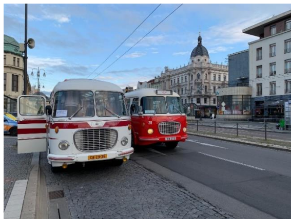
Autobus RTO LUX v Pardubicích

Například náš autobus RTO LUX byl přítomen u tradičních Lázní ducha v nedaleké Litomyšli, v Pardubicích na zahájení festivalu Muzejní noci a nemohl chybět na Sodomkově Vysokém Mýtě. Dalším zajímavým exemplářem je Tatra 613. Tento vůz, před pár lety získaný od firmy IVECO, Czech