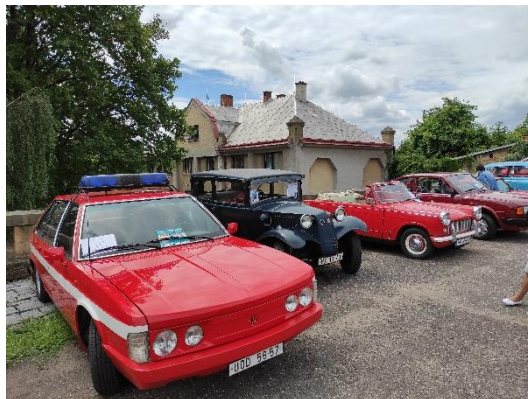
Muzejní Tatra 613 v Holovousech

Republic, navštívil první ročník Moto kavárny na zámku v Holovousech. Protože Tatra při této vyjíždce obstála, rozhodli jsme se ji využívat častěji, konkrétně během komentovaných projížděk městem. Více se o této výjimečné zážitkové akci i samotném voze dozvíte níže.