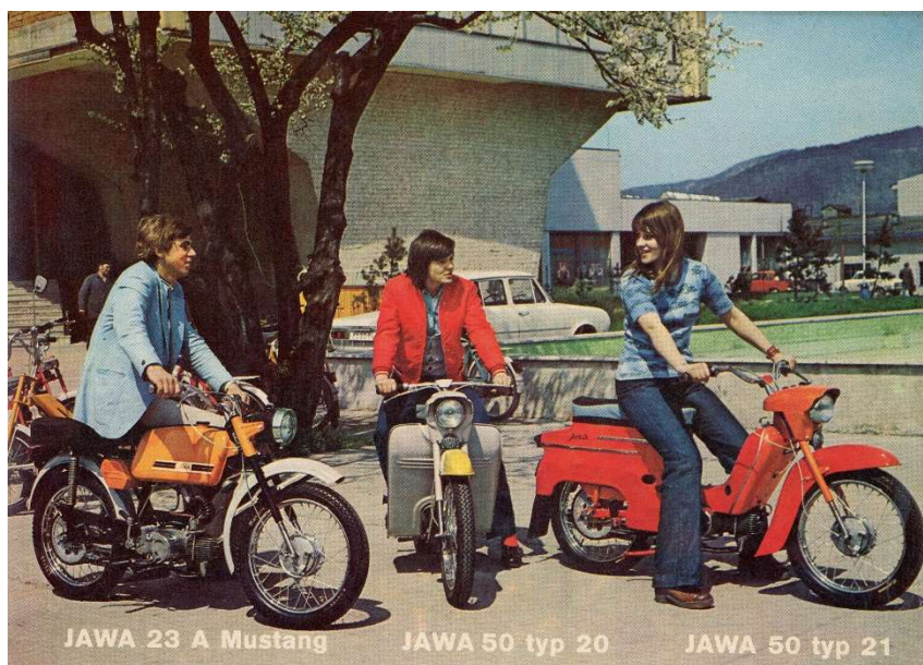
JAWA 23 A Mustang

Jsou dopravní prostředky, které nás v průběhu času v rychlosti minou a vedle toho jsou takové, které se z různých důvodů stanou legendami. A o takové jedné legendě si vysokomýtské muzeum připravilo výstavu.