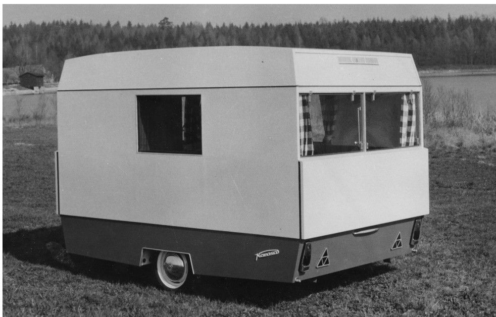
Prototyp obytného přívěsu typu SW 1 "Racek" z roku 1967 na propagační fotografii u rybníku Chobot.