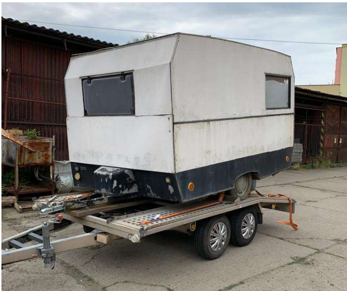
Obytný přívěs Karosa SW 1 „Racek“ ve sbírkách Regionálního muzea ve Vysokém Mýtě.

I když je podnik Karosa obecně spjat zejména s autobusy a užitkovými nákladními automobily, k důležité součásti výrobního programu patřila také produkce obytných přívěsů. Vysokomýtské muzeum má ve svých sbírkách zastoupený jak dnes již legendární „Dingo“, tak i unikátní lůžkový přívěs Karosa LP 30. Snahou bylo doplnit ucelenou řadu sériově vyráběných přívěsů také posledním typem SW 1 „Racek“, což se podařilo koncem června tohoto roku. Jde o stopadesátý zhotovený kus z roku 1969 v předrenovačním stavu. Prototyp určený pro 4 osoby vyjel z bran hořického závodu již v roce 1967 a produkce probíhala do počátku 70. let, a to i v prodloužené verzi pro 6 lidí. Není bez zajímavosti, že jeden z „Racků“ byl vyrobený jako hausbót a opatřený přívěsným lodním motorem.