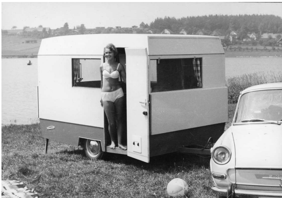
Propagační fotografie přívěsu SW 1 „Racek“ u přehrady Seč.

Výstavy | Akce | Doprovodné akce | Novinky z muzea