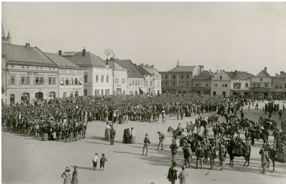
Odchod zeměbraneckého 30. pěšího pluku na ruskou frontu dne 21. srpna 1914.