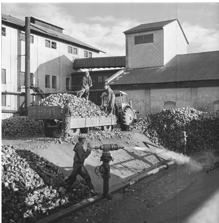
Řepná kampaň v cerekvickém cukrovaru, 60. léta

Zatímco výstava o motocyklech Pionýr byla s vůní benzínu, tak nová výstavní počín bude vonět po jídle. Přesněji řečeno po jedné zásadní potravinářské ingredienci. Vždyť za co by stál život, kdybychom si ho nemohli osladit? Přiblížme si proto dějiny rafinovaného cukru a jeho výroby a použití. Jaká je vlastně cesta od výsevu malého semínka řepy až po bílou kostku na našem stole? Kdy byla zlatá doba českého cukrovarnictví? Kolik se spotřebovalo cukru před sto lety a kolik dnes? Kde všude se cukr používá? To jsou jen některé otázky, na které výstava odpoví. Vedle toho se zaměří na cukrovinky a kulturu cukráren v první polovině 20. století.